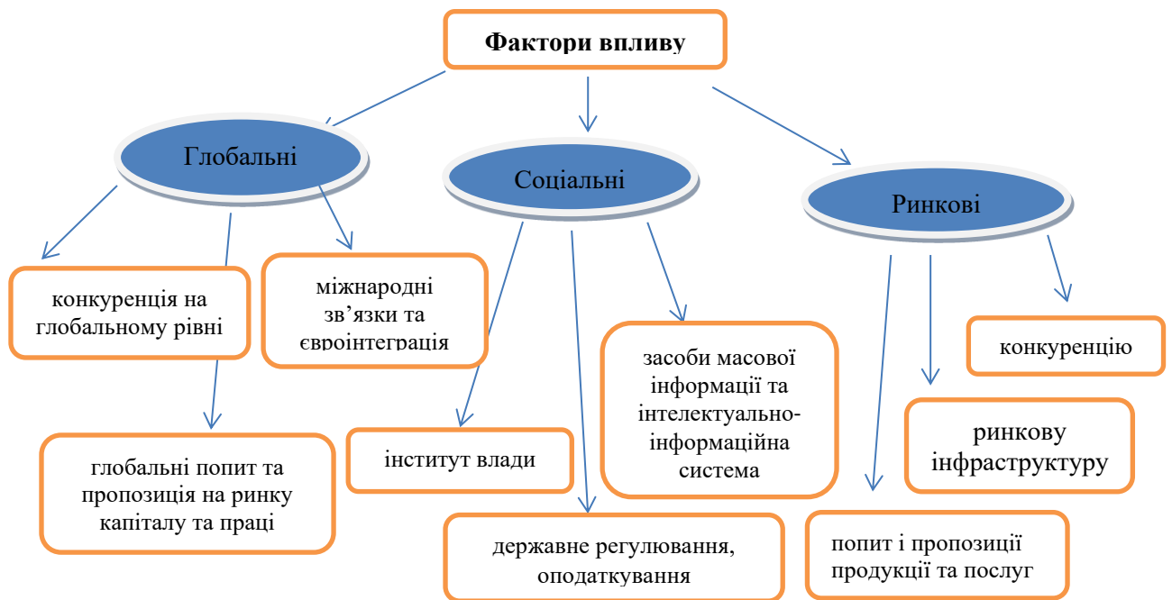
Рис. 2. Фактори впливу на інноваційний розвиток