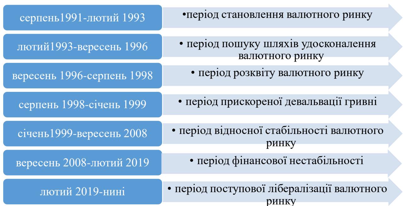
Рис. 3. Етапи розвитку валютного ринку України

Історичний характер валютного ринку проявляється не лише у створенні нових форм валютного регулювання та функціонування, а й в еволюції кожної форми зокрема. Еволюція валютного ринку – це основні етапи їх розвитку. У ході дослідження історії валютного ринку виявили, що багато науковців виділяють чотири етапи розвитку валютного ринку, проте вважаємо за доцільне виділити такі етапи (рис. 3).