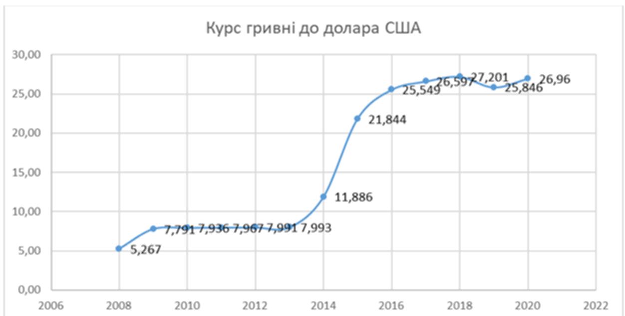
Рис. 4. Динаміка курсу національної валюти до долара США за період 2008–2019 рр.

Завдяки проведеним заходам НБУ у 2009 році гривня набула стабільного характеру з коливаннями курсу в незначних межах. Суттєво вплинула на курс політична криза 2014 року, досягнувши позначки 11,886 грн за 1 дол. США, що на 48,7 % більше порівняно з минулим роком (рис. 4). Локальна валютно-фінансова криза супроводжувалася впливом капіталу, спричиненим проведенням антитерористичної операції та дефіцитом валюти на внутрішньому ринку, зокрема через скорочення надходжень іноземної валюти від експорту та падінням обсягів валютних резервів НБУ. Можемо зауважити, що діючий монетарний режим, якорем якого був фіксований валютний курс, та механізм валютного регулювання не спроможні захистити національну валюту від знецінення в умовах розгортання кризи. З 2015 року НБУ змінив монетарний режим, перейшовши до інфляційного таргетування та гнучкого курсоутворення [Береславська, 2016].