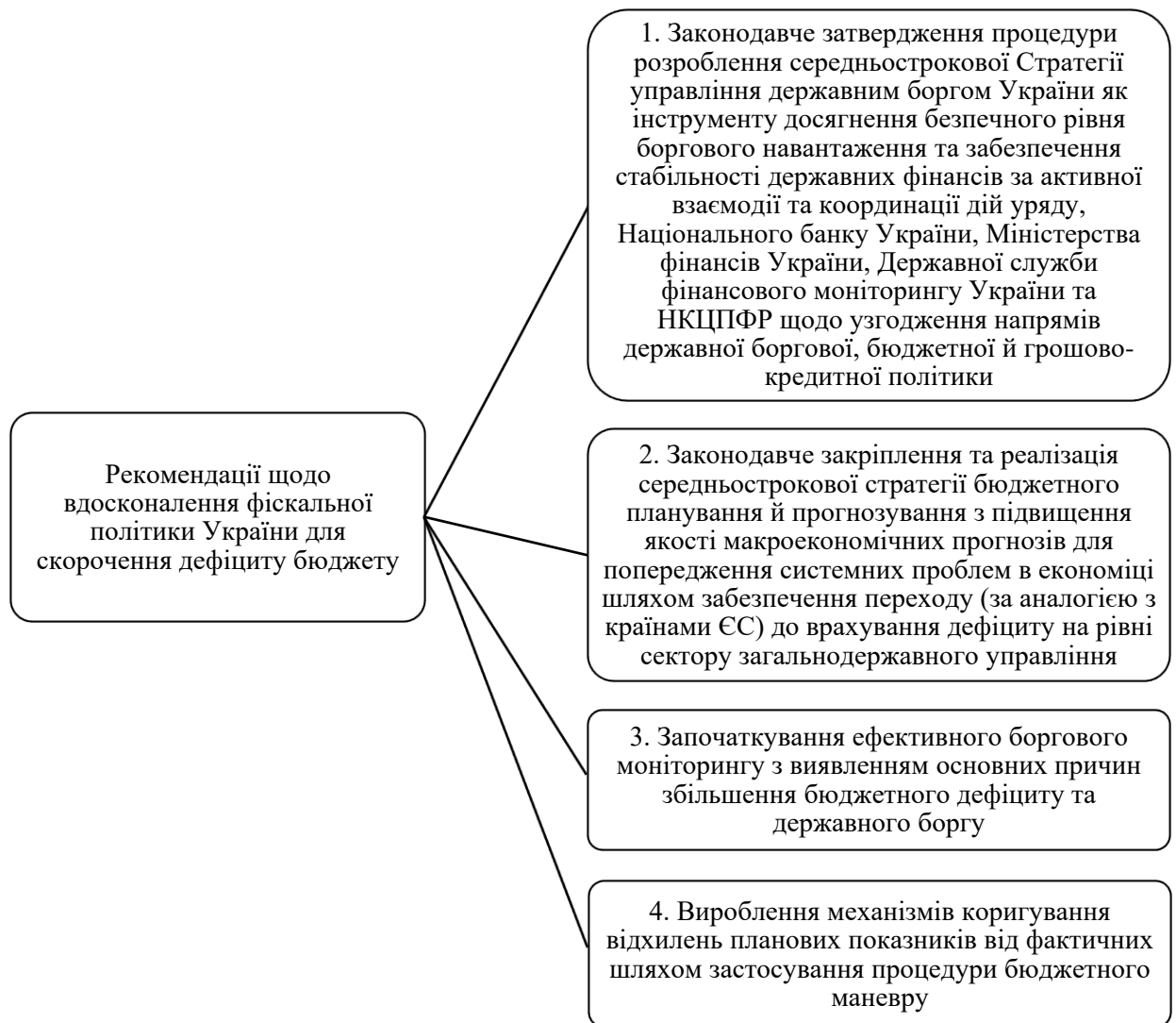
Рисунок 3 – Рекомендації щодо вдосконалення фіскальної політики України для скорочення дефіциту бюджету [9; 10]

Модернізація національної системи фіскальних правил і супутніх заходів для підвищення її цілісності та застосування різних часових горизонтів дозволить детально регламентувати фіскальну політику, зменшити вплив циклічних коливань і макроекономічних шоків на боргову сферу, та, відповідно, дозволить покращити комплексність і гнучкість системи управління фінансовою безпекою, зокрема бюджетною та борговою [11, с. 193].