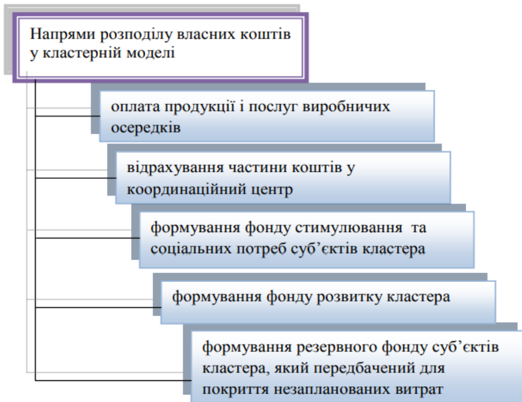
Рисунок 2 – Напрями розподілу власних коштів у кластерній моделі