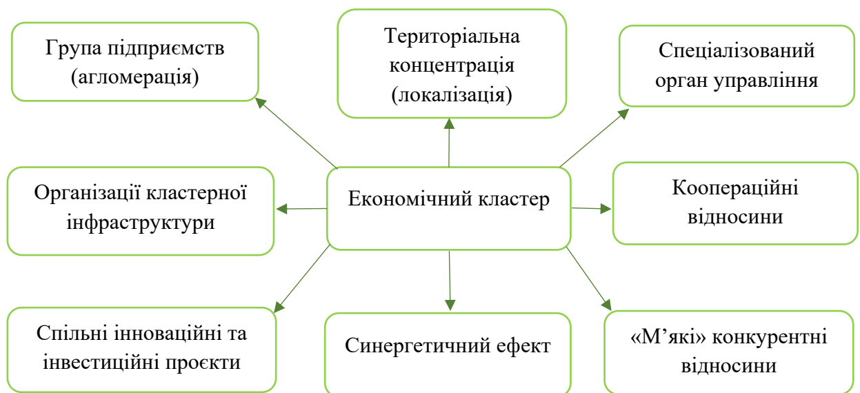
Рисунок 1 – Основні риси сучасного кластеру в Україні

Основні риси побудови сучасного кластеру в Україні, відображені на рис. 1.