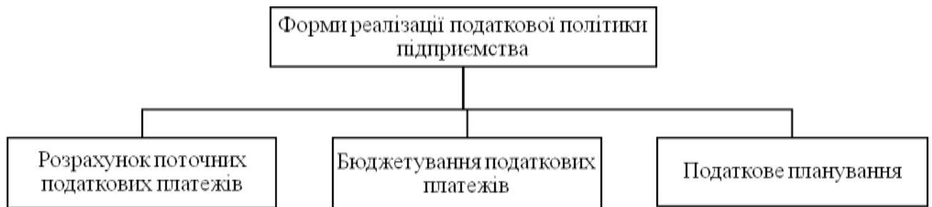
Рис. 1. Податкове планування як одна із форм реалізації податкової політики підприємства

Окремі дослідники розглядають податкове планування як одну з форм реалізації підприємством податкової політики (рис. 1). І якщо розрахунок поточних податкових платежів та їх бюджетування дозволяють лише визначити податкові зобов'язання платника на якийсь податковий період з огляду на вже обраний спосіб ведення господарської діяльності, тобто зафіксувати податкові наслідки виконання запланованих господарських операцій, то податкове планування включає активне використання певних інструментів податкової політики підприємства для зменшення бази оподаткування або ж її переміщення на пізніші періоди. У підсумку це дає змогу обрати найбільш доцільний у конкретних умовах різновид господарської діяльності з позицій забезпечення податкової оптимізації і чистого прибутку [12, с. 196; 13, с. 31].