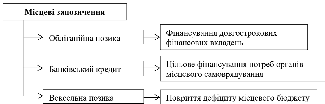
Рис. 1. Види місцевих запозичень та напрями їх використання